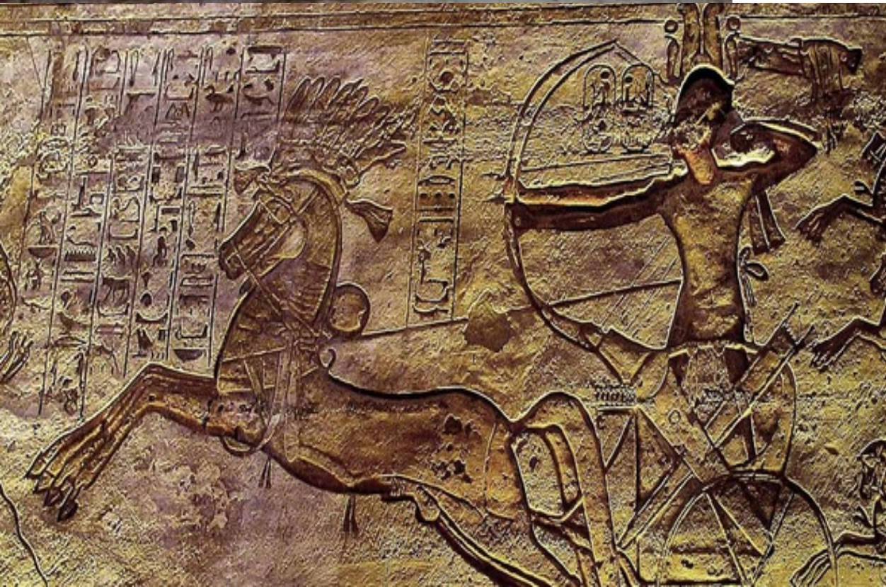
Египетский фараон мчится на колеснице

Современный мир с развитием техники вытеснил лошадей из жизни человека. Но, необходимо помнить о том, что история человека неразрывно связана с лошадью, о чем свидетельствуют наскальные рисунки в пещерах.