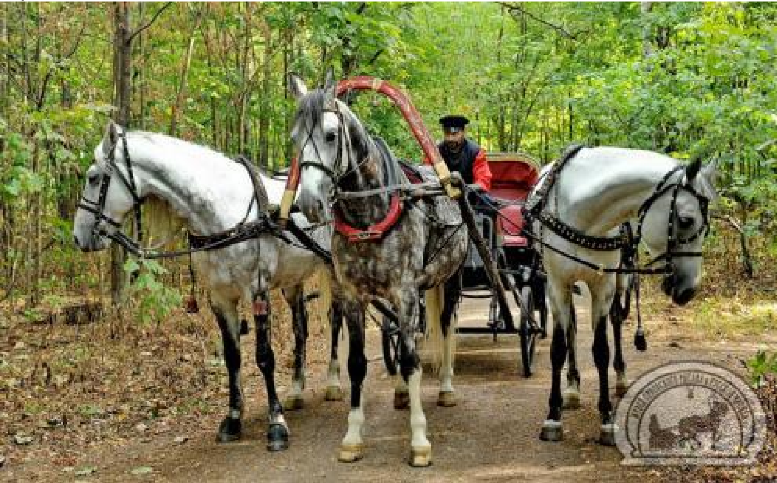
Тройка Музея Орловского Рысака и Русской Тройки

На выставке я узнала о существовании Музея Орловского рысака и Русской тройки. В музее можно увидеть старинные экипажи и упряжь, полистать старые книги, посвященные орловскому рысаку, полюбоваться на картины. А, главное, здесь можно погладить настоящих орловских рысаков и прокатиться на русской тройке.