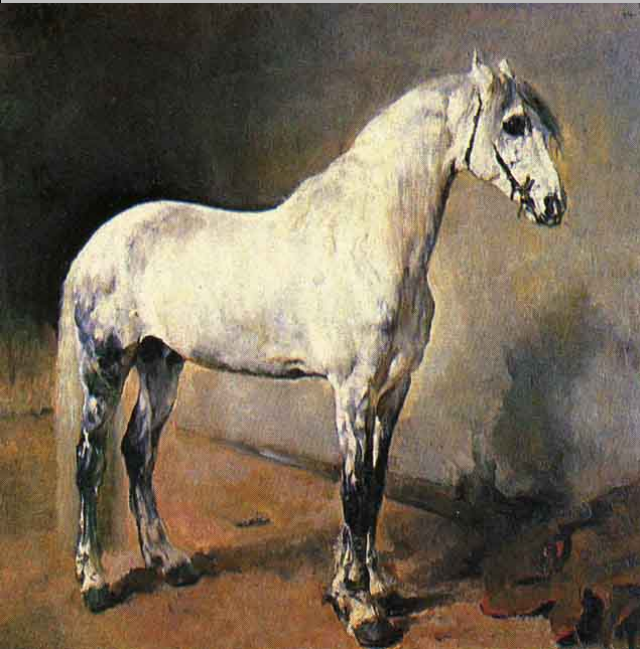
В.А. Серов «Летучий»