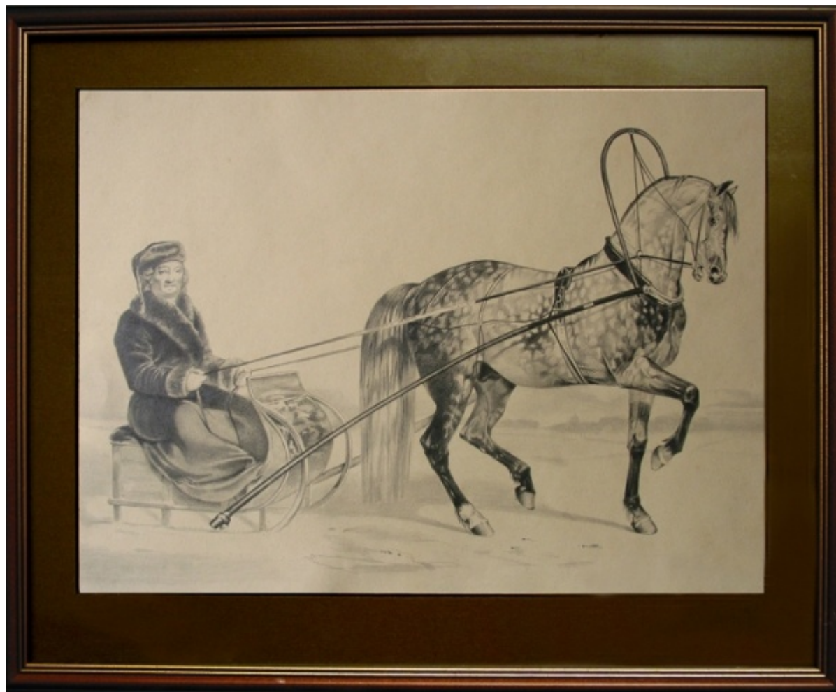
Н.Е.Сверчков. «Граф Орлов на Барсел» 1890г.

И так, 1784г. появился на свет знаменитый Барсел . Был он серой масти, большого роста, правильного телосложения, силу имел необыкновенную и отличался резвой рысью. Барсел считается родоначальником породы орловских рысаков.