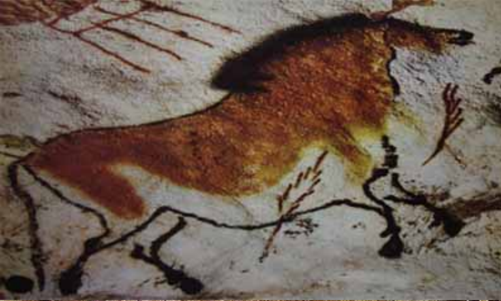
Лошадь, пещерная живопись, палеолит, пещера Ласко, Франция.