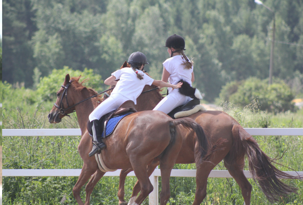
Конные игры. Игра «ЛИСА».